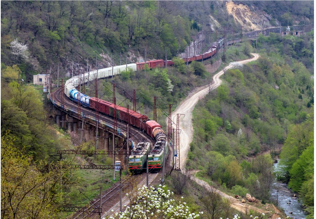
Рисунок 2.1 – Участок Ципа - Молити

К основным предпосылкам обновления парка электровозов Грузинской железной дороги относятся: