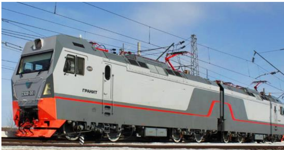
Рисунок 5 - Электровоз 2ЭС10

Технические параметры сравниваемых электровозов приведены в таблице 1 и приняты: