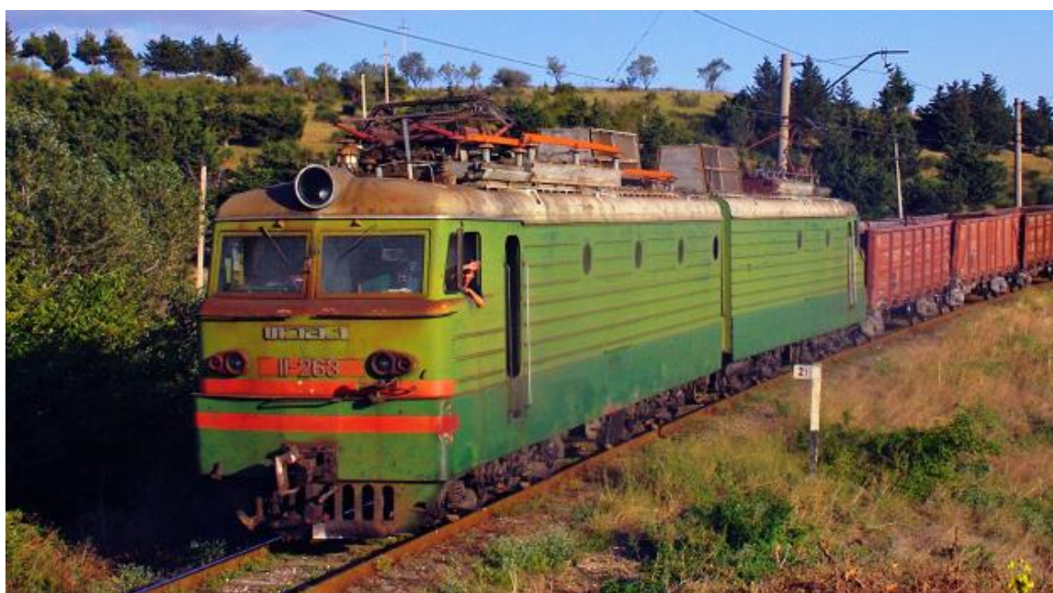
Рисунок 4 – Магистральный грузовой электровоз ВЛ11

Электровоз ВЛ11 (модификации ВЛ11.8, ВЛ11М) - советский грузовой магистральный электровоз постоянного тока, выпускавшийся с 1975 по 2008 год. Электровоз разработан на базе ВЛ10, но с незначительно увеличенной мощностью и доработки конструкции. Так же в распоряжении Грузинской железной дороги имеются модифицированные серии электровоза ВЛ11, такие как ВЛ11.8 (отличались изменёнными электрическими схемами и не могли работать совместно с серией ВЛ11, всего выпущено 259 единиц) и ВЛ11М (основное отличие модернизированных электровозов серии ВЛ11М состоит в возможности полноценной, с переходами без сброса контроллера на ноль, работы на трёх соединениях тяговых электродвигателей независимо от числа секций). Общий вид электровоза ВЛ11 представлен на рисунке 4.