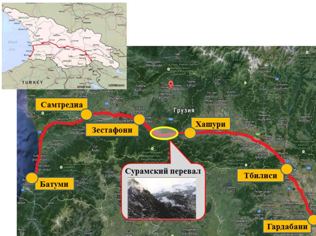
Рисунок 2 – Схема расчетного участка Грузинской железной дороги

13% небольшой протяженности), исключением является участок железной дороги между станциями Зестафони – Хашури (Сурамский перевал, схематично показан на рисунке 2), подъемы на котором достигают 29,3% в нечетном направлении.