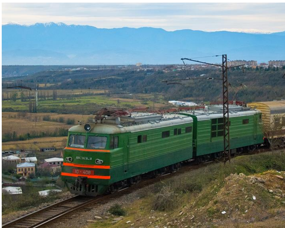
Рисунок 3 - Общий вид электровоза ВЛ10

Электровоз ВЛ10 (рисунок 3) - магистральный грузопассажирский электровоз постоянного тока, выпускавшийся Тбилисским и Новочеркасским электровозостроительными заводами с 1961 по 1977 годы. Был создан с использованием части электрооборудования электровозов серии ВЛ8, по механической части унифицирован с электровозами серии ВЛ80. Послужил основой для электровозов ВЛ11. С середины 1960-х основной грузовой локомотив на линиях постоянного тока. Самая массовая модель в модельном ряду НЭВЗ и ТЭВЗ из локомотивов постоянного тока.